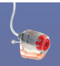
RIE ou RIC

Ce sont de micros embouts sur mesure destinés aux écouteurs de toutes les marques d'appareils auditifs, ils sont fabriqués en résine dure ou en Thermotec.